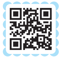
《幼儿园教育指导纲要（试行）》