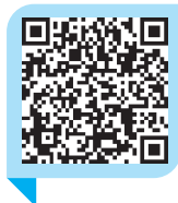
霍兰德职业兴趣测试

首先，大学生应正确认识自我，根据自己的身体情况、兴趣、个性及能力等方面的因素确定自己的社会位置。一些大学生在择业时不同程度地存在自大、坐等、自卑、依赖、侥幸等消极心态，存在以个人为本位的观念，这必然会影响他们的正常择业，导致择业出现偏差。大学生应以积极向上、乐观自信、勇于竞争的良好择业态度迎接就业，调整好自我与社会、奉献与索取的关系；当进行职业规划时，要做到不过高地估计自己，也不妄自菲薄，找准自己的社会定位，这样才能有利于自身价值的实现。