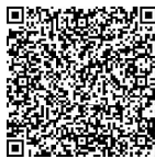
微课 安全教育的范 围

人身安全是大学生生存和完成学业的首要条件,也是大学生最基本、最重要的安全要求。但是,大学生在校内外遭受人身伤害的案例却频频发生,这给他们的生活、学习乃至生命安全都造成了极大的威胁。目前,大学生人身安全隐患突出地表现在以下几个方面:一是校内学生无视校规校纪,打架斗殴造成人身伤害,或者遭受校外不法分子的无端滋扰;二是在人际交往中,部分大学生由于存在一定的心理障碍或处理人际关系的能力欠缺,在同学摩擦、老乡往来或异性相处中造成他人人身伤害;三是在社会实践和工作实习中,由于防范意识薄弱、违反操作规程等原因造成意外人身伤害;四是大学生在就业求职活动中因遭遇求职陷阱,人身安全受到威胁;五是女大学生遭遇非法性侵害。因此,加强大学生的人身安全教育,使其掌握自我保护和安全防范的基本知识和技能,对于保证大学生的身心健康成长是非常必要的。