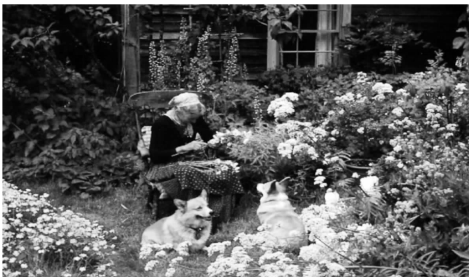
图 1-5 塔莎奶奶

跟人有过多的交往。她继承了父亲丰富的想象力和母亲的绘画天赋,从小就开始画图画书。9岁时,父母离婚,塔莎开始了在亲朋好友家的寄养生活。15岁时,塔莎放弃了自己的学业,开始了自给自足的农业生活,并且开始给小朋友画图画。这种生活方式伴随她的一生。塔莎从23岁发表处女作后,陆续创作了80多册的绘画作品,并获奖无数。她的画作深深地影响了无数孩子。57岁时,塔莎开始构想营造更广阔的庭院结构。她把家搬到美国东部的一个小镇,并拥有约100万平方米的土地,把那里建造成一个农场,从此开始了愉快惬意的田园生活。家里的装饰构造全部是18世纪的风格。在这个农场里,她写书、画画、种草、种花、种果树。同时,她还做各种手工艺品和美食。美丽优雅的塔莎奶奶于2008年离开了这个世界,享年93岁。