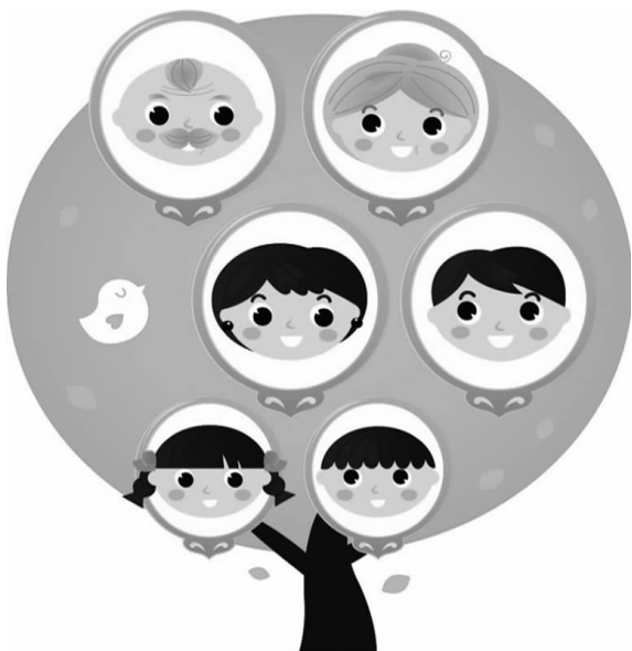
图 1-3 家庭职业树

自古以来,家庭成员的职业对个人的职业选择和发展都有巨大的影响。了解职业,一般从身边的人开始,如果把你的家庭职业比喻为一棵大树(图 1-3),回答下列问题。