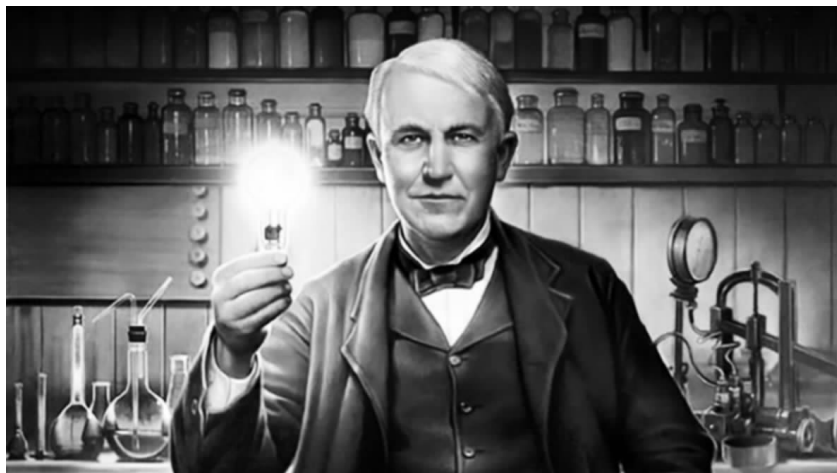
图 1-4 爱迪生

爱迪生(1847—1931,图 1-4),美国著名发明家、企业家,1847 年生于美国俄亥俄州米兰镇。他 8 岁上学,只读了 3 个月就退学了,老师骂他“小笨蛋”;他因为经常问“为什么”而让老师下不了台;他对大自然非常好奇,曾专心致志观察榆树叶芽怎么生长,秋风如何使枫叶变色。为了试验孵小鸡,他长时间趴在鸡窝里;为了探索蜂巢的奥秘,他被蜇得鼻青脸肿;为了试验摩擦生电,他在皮毛上拼命地搓揉,直到双手伤痕累累。9 岁那年,他得到《自然与实验哲学》一书,如获至宝,逐页研读,逐项试验。为此,他在家中的地窖里建起一个小实验室。为了生活,从 12 岁起,他开始在列车上卖报,同时把自己的实验室搬到火车上,利用一切机会学习和做实验。