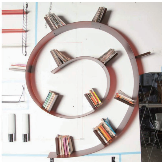
图 1-3 Bookworm 书架