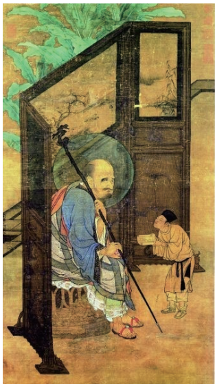
图 1-2 南宋刘松年《罗汉图》轴中的宋代屏风

家具由材料、结构、外观形式和功能四种要素组成。其中，功能是先导，是推动家具发展的动力；结构是主干，是实现功能的基础。这四种要素相互联系，又相互制约。由于家具是为了满足人们一定的物质需求和使用目的而设计与制作的，因此家具还具有材料和外观形式方面的要素。（图 1-3）