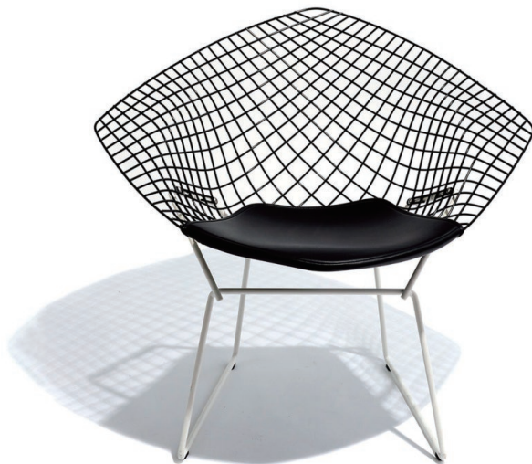
图 1-6 钻石椅 / 美国 / 哈里·别尔托亚

哈里·别尔托亚（Harry Bertoia）以不同的形状、方式焊接金属，在平凡的工业材料中找到一种至高的优雅，使其超越了正常的用途，成为一件实用艺术品。钻石椅是别尔托亚“玩钢丝”的实验产物，也是对空间、形式、功能的惊人研究。用别尔托亚自己的话说：“如果你看着这些椅子，它们几乎是由空气做成的，就像雕塑，空间从它们中间穿过。”（图 1-6）