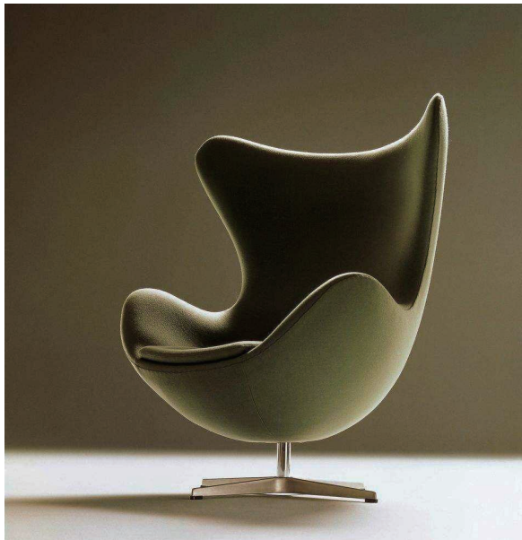
图 1-5 蛋壳椅