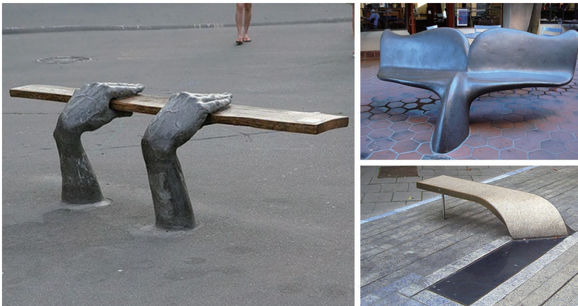
图 1-9 室外座椅