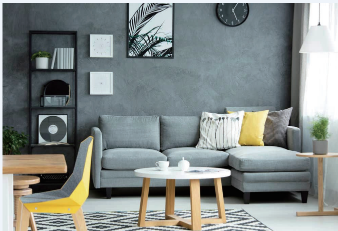
图 1-1 家具

图 1-1 所示为一间私人住宅空间物品照片，从照片中找出多少件家具？它们分别是什么？哪些不属于家具的范畴，为什么？