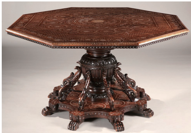
图 1-4 拜占庭风格家具 / 意大利威尼斯

家具有着漫长的发展历史。在历史长河中，世界上不同的国家根据各自的社会发展历程生产出不同需求的家具类型，每个特定的历史时期又会出现不同的家具风格类型。因此，按时间段划分，家具可分为古代家具（或称原始家具，特点是形态粗简、材料天然）、过渡时期（中世纪之后到文艺复兴时期）家具和现代家具。（图 1-4）