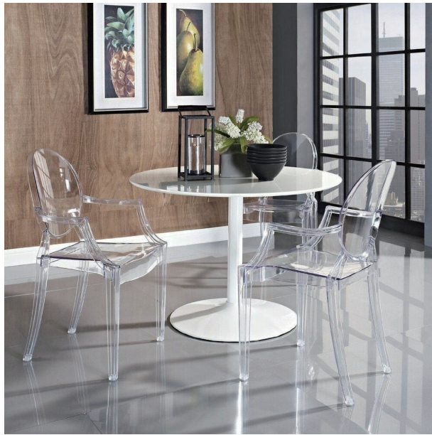
图 1-7 路易斯幽灵椅 / 法国 / 菲利普·斯塔克

当代设计师菲利普·斯塔克（Philippe Starck）2002年设计出路易斯幽灵椅（Louis ghost chair）。斯塔克改造了法国路易十五时期经典的巴洛克风格扶手椅，将各种线条和几何形状转化为单一模具，注塑成型透明的聚碳酸酯椅子。路易斯幽灵椅看上去若隐若现，仿佛只有当注意到它时它才存在，所以无论把它放在什么风格的房间内，都不会成为碍眼的单品。同系列还有一款无扶手椅，即维多利亚幽灵椅（Victoria ghost chair）。（图 1-7）