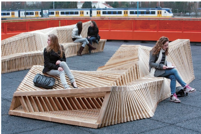
图 1-8 公共桌椅

家具按使用地点不同可分为室内家具和室外家具或民用家具和公用家具。民用家具是人们日常生活的必需品，公用家具是公共场所、办公空间和商用空间的家具。室内家具种类最为丰富多样，可满足不同用户的需求；室外家具又被称为“城市家具”，范围广泛，包括公共桌椅和公交站台等。（图 1-8~图 1-10）