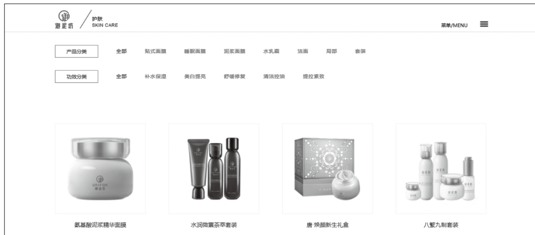
图 1-3 某护肤品品牌的官方网站

器维护等工作。由于是自主设计的网店，可以体现出独特的设计风格，不同于自助式开店，会受限于商城的模板。图 1-3 为某护肤品品牌的官方网站。