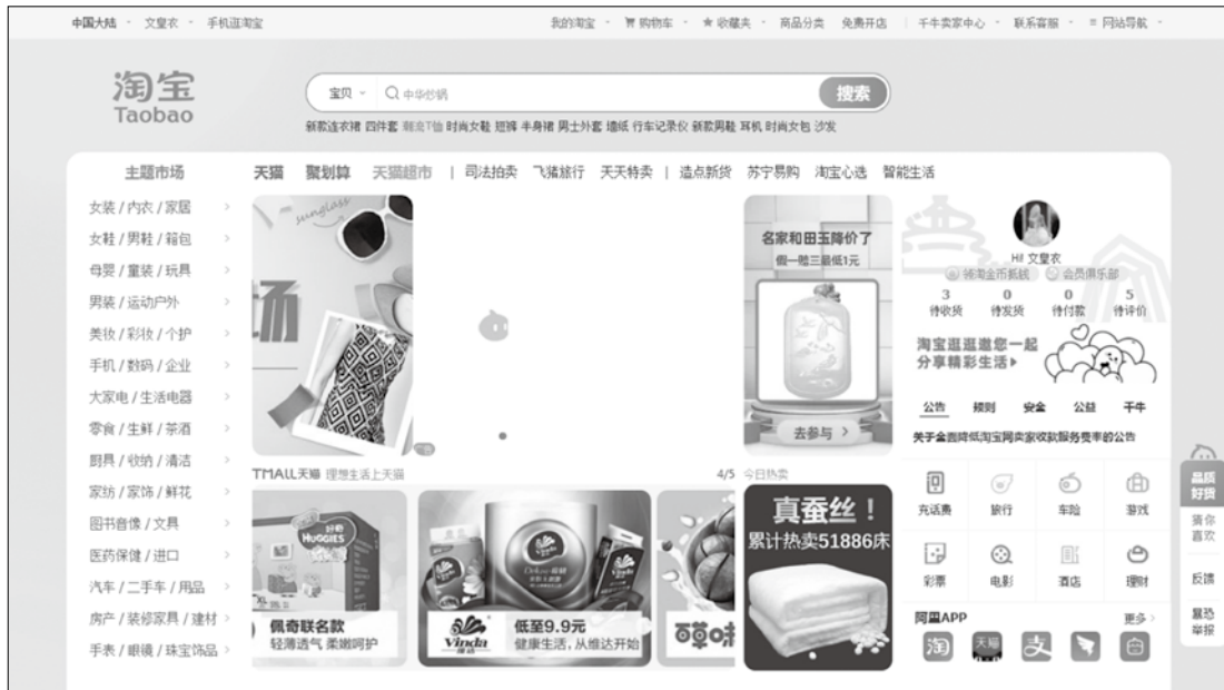
图 1-4 淘宝网首页

城的是，它不要求企业有 100 万元以上的注册资金、两年以上的经营时间、品牌注册商标和纳税身份等。图 1-4 为淘宝网首页。