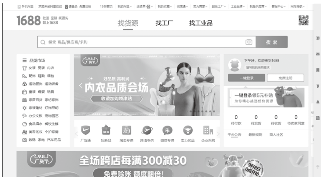
图 1-7 1688 网站首页