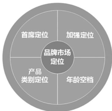
图 1-2 电商的品牌定位方法

(1) 首席定位。首席定位是追求成为行业或某一方面“第一”的市场定位。品牌一旦占据领导地位，冠上“第一”的头衔，便会产生聚焦作用、光环作用、磁场作用及“核裂变”作用，从而具备追随型品牌所没有的竞争优势。