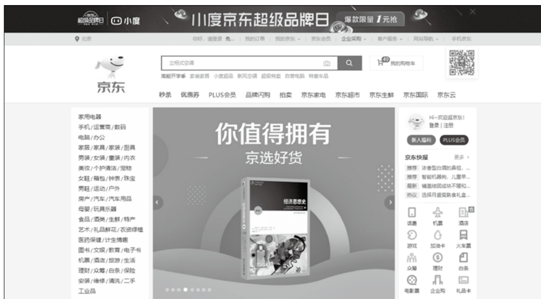
图 1-8 京东商城首页

除了上述电商平台，部分实力较强的卖家还可以选择京东商城（见图 1-8）、苏宁易购（见图 1-9）等 B2C 电商平台。此类平台对商家的资质有一定的要求。