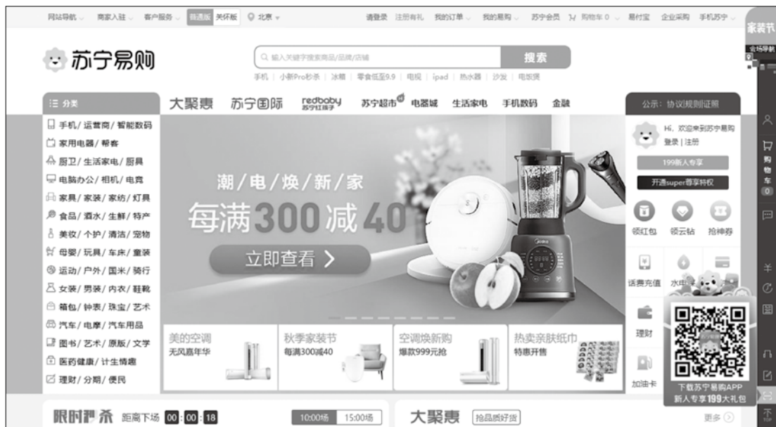
图 1-9 苏宁易购首页