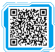
图文 购买数码相机注意 事项

(2) 数码相机。由于网店的商品主要是通过图片展示给消费者的，图片的精细程度直接关系到商品的出售率，因此需要一台品质好的数码相机。品质好的数码相机可以还原更多商品细节，减少后期处理工序，节约时间。