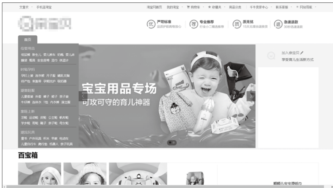
图 1-5 某淘宝网店铺页面