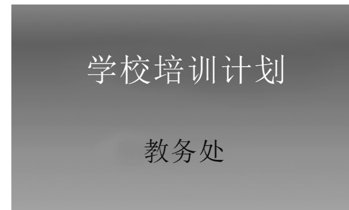
第 65 题图