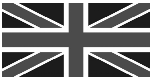
图 1-4 英国国旗

英国国旗(见图 1-4)是由深蓝色的底和红色、白色的米字组成的米字旗。旗中带白边的红色正十字代表英格兰守护神圣乔治,白色交叉十字代表苏格兰守护神圣安德鲁,红色交叉十字代表爱尔兰守护神圣帕特里克。此旗产生于 1801 年,是由原英格兰的白底红色正十字旗、苏格兰的蓝底白色交叉十字旗和北爱尔兰的白底红色交叉十字旗重叠而成的。