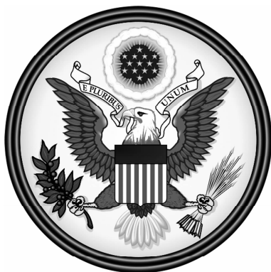
图 1-9 美国国徽

美国国徽(见图 1-9)的主体是胸前带有盾形图案的白头鹰,白头鹰是美国的国鸟,是力量、勇气、自由和不朽的象征。白头鹰的双翅展开,左右鹰爪分别抓着象征和平和武力的橄榄枝和箭。鹰目视左方,象征期望和平。鹰嘴叼着的绶带上用拉丁文写着“合众为一”。