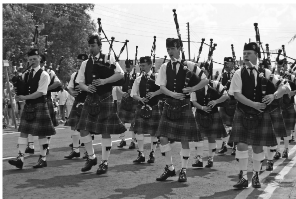
图 1-7 苏格兰短裙

威尔士人和爱尔兰人以热爱音乐和诗歌著称。威尔士人有两大爱好——英式橄榄球和合唱,爱尔兰人中有许多杰出的文学家,如王尔德、萧伯纳等。按传统的观念,英格兰人被认为是保守、不易接受新思想,不喜欢表露感情,却有着极高的荣誉感、责任感,注重礼节的民族。随着时代的发展,今天的英格兰人和其他民族一样富有鲜明的个性和时代感。