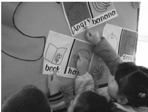
图 1-2 英语角

英语的一个区域(见图 1-2)。在英语角,教师要投放材料并指导幼儿活动。如在幼儿学过苹果、梨、橘子等水果的名称后,教师可制作一棵立体树,在英语角中投放一些橡皮泥、未涂色的水果卡片,让幼儿用橡皮泥捏制水果或给水果卡片涂色,然后用曲别针将自己的作品挂在树上,幼儿一边操作,一边用英语说水果的名称,在反复练习英语的同时,幼儿的动手能力、辨别色彩的能力也得到了相应的提高。再如,在幼儿学习人体器官后,教师准备不同器官的拼图和纸笔,在活动中引导说:“我今天给自己画个像,你们看。”边根据拼图画出各器官边用英语说:“This is my head. This is my eyes. This is my nose.”幼儿一下子就被吸引住了,争着来给自己画像,嘴里大声说着“This is my...”。由于英语角教学具有趣味性和可操作性,所以深受幼儿的喜爱,是幼儿主动学习的场所。