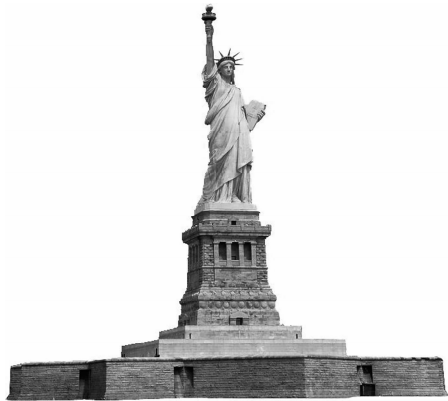
图 1-10 自由女神像

美国的标志性建筑物是自由女神像(见图 1-10)。自由女神像是法国在 1876 年赠送给美国独立 100 周年的礼物,位于美国纽约市海港内的自由岛的哈德逊河口附近。自由女神像高 46 米,加基座为 93 米,重 200 多吨,由金属铸造,置于一座混凝土制的台基上。自由女神像已成为美国人民争取民主、向往自由的象征。