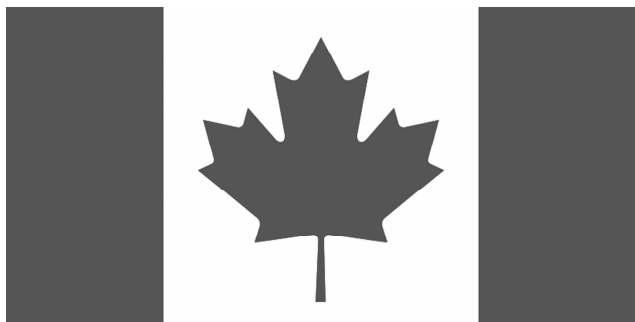
图 1-11 加拿大国旗

加拿大国旗为枫叶旗(见图 1-11)。国旗由红白两色组成。中间的白色正方形代表加拿大广阔无垠的国土,红色枫叶象征生活在加拿大富饶国土上辛勤努力的人民,两侧红色竖长方形分别代表与加拿大相邻的大西洋及太平洋。