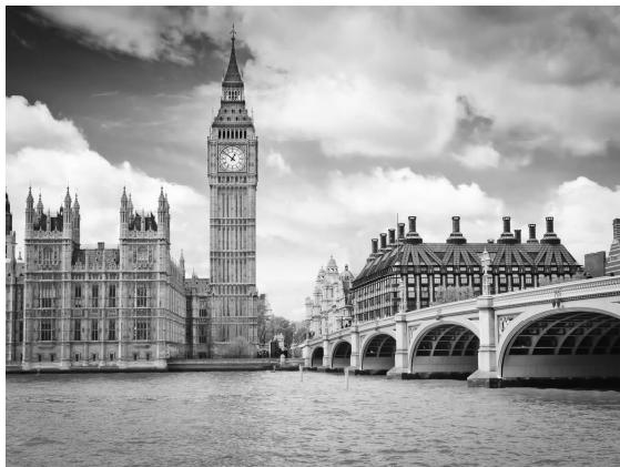
图 1-6 伊丽莎白塔(大本钟)

英国的标志性建筑是大本钟(2012 年更名为伊丽莎白塔,见图 1-6),大本钟耸立在泰晤士河畔,高约 95 米,重近 14 吨,由总工程师本杰明爵士监制。自建成以来,它以稳重深沉的钟声为人们报时已达 150 多年,被视为伦敦的象征、英国的标志,至今 BBC(英国广播公司)仍每天以其钟声报时。