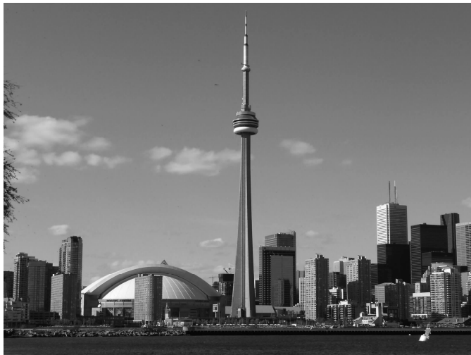
图 1-13 加拿大国家电视塔

加拿大国家电视塔(见图 1-13)是一座位于加拿大安大略省多伦多的电波塔,塔高 553.33 米,被认为是多伦多的地标。