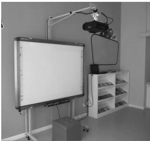
图 1-3 电化教育设施

幼儿边玩边听,幼儿在反复听的过程中学习了语音语调,建立了语感,在脑海里留下了一定的印象,使他们更容易掌握英语的相关知识。另外,我们利用电教手段可以突破教学中的难点,如在学 on 和 under 的用法时,教师设计了“小动物捉迷藏”这一活动,利用投影仪,使用复合片和抽拉片让小动物分别藏在桌上、椅子下、书上、床下等,直观、形象的小动物游戏使幼儿很快区分了 on 和 under 的意义及用法。利用电化教育手段可以吸引幼儿的学习兴趣,让幼儿在好奇中主动学习。另外,选择适合幼儿的影像播放给幼儿看,在画面与音乐、情景与对话的共同作用下,给幼儿提供一种身临其境的语言环境,加之影像的可控性、可重复性,对幼儿的反复学习、巩固有极大的帮助。