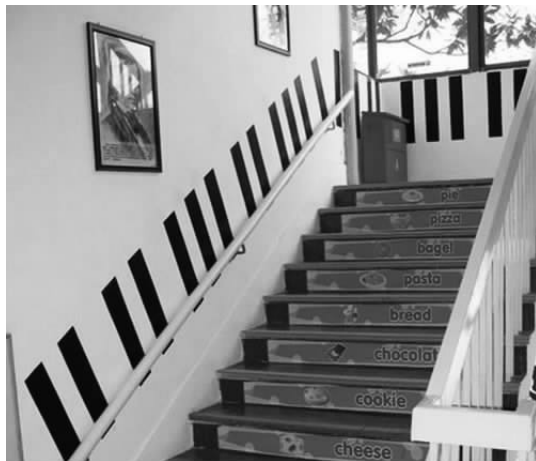
图 1-1 利用室内楼梯创设环境

根据不同的场所创设不同的画面,写上相应的英文句子,给幼儿创造一个英语习得的大环境。如在楼梯上贴上常见食物的图片,并写上相应的英语单词(见图1-1);在楼道的墙面上画上几个小脚印,写上“ Go for a walk ”;在图书角的墙面上画一张嘴,再画一根抵住嘴唇的食指,下面写上“ Please be quiet! ”在洗手池上面的墙面上画上小朋友洗手和小水滴,水滴上写上“ Please wash your hands! ”等。幼儿经常处于英语视觉刺激的环境中,每时每刻都处在英语氛围中,耳濡目染,从而达到习得英语的效果。在有鲜明主题的大墙面上,教师可根据教育目标和幼儿的实际水平设计图画与英语,如在教育幼儿爱幼儿园的墙面上,首先是“ We go to kindergarten ”,然后是“ We are in the kindergarten ”,最后是“ We are happy ”,再配上相应的图画,这样既对幼儿进行了入园、爱园的教育,又教会幼儿用英语表达清楚画面的意思,发挥了墙面环境的多种教育功能。