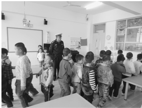
图 3-1 小朋友练习遵守交通规则

社会化主要是指个体学习社会中长期积累起来的知识、技能、观念和规范,并内化为个人的品格与行为,在社会生活中加以再创造的过程。例如,幼儿园请交警叔叔带领小朋友练习遵守交通规则,如图 3-1 所示。