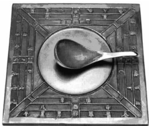
图 2-1 司南

来,人们将鱼片改成细小的磁针,真正的指南针便诞生了,如图 2-3 所示。指南针一经发明很快就被应用到军事、生产、日常生活、地形测量等方面,特别是航海上。北宋末年的《萍洲可谈》中记有:“舟师识地理,夜则观星,昼则观日,阴晦则观指南针。”这是世界航海史上最早使用指南针的记载。宋代,我国海上航运大发展,这和指南针在航海上的普遍使用有密切关系。这一发明后来经阿拉伯传入欧洲,对欧洲的航海业乃至整个人类社会的文明进程,都产生了巨大影响。