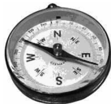
图 2-3 指南针