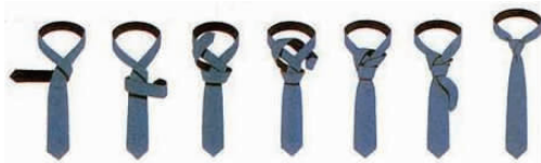
图4-2 交 叉 结

②交叉结(见图4-2)。交叉结是适合单色素雅、质料较薄的领带选用的领结。对于喜欢展现流行感的男士不妨多加使用。