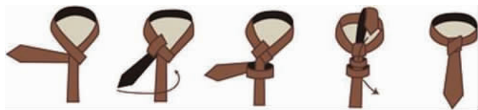
图 4-5 半温莎结

⑥双交叉结(见图 4-6)。双交叉结很容易体现男士高雅且庄重的气质,适合正式活动场合选用。双交叉结应多运用在素色且丝质的领带上,若搭配大翻领的衬衫,则不但适合,而且有种尊贵感。领带结需靠在衣领上,但又不能勒住脖子,也不能太往下,以免显得松松垮垮、不精神。领带系好后,垂下的长度应触及腰带,超过腰带或不及腰带都不符合要求。