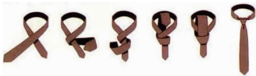
图4-1 平 结

①平结(见图4-1)。平结为男士选用最多的领带打法之一,几乎适用于各种材质的领带。领结下方所形成的凹洞,需让两边均匀且对称。