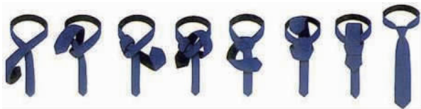
图4-4 温 莎 结

④温莎结(见图4-4)。温莎结适用于宽领的衬衫。该领结多往横向发展,应避免材质过厚的领带,领结也勿打得过大。