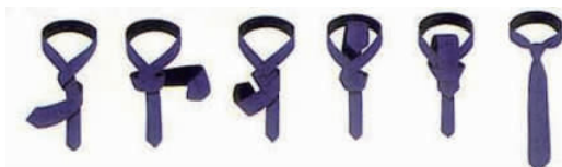
图4-3 双 环 结

③双环结(见图4-3)。双环结能营造时尚感,适合年轻的上班族选用。该领带打法完成的特色是第一圈会稍露出于第二圈之外,千万不要刻意给盖住。