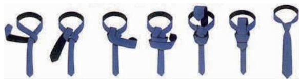
图 4-6 双交叉结

⑥双交叉结(见图 4-6)。双交叉结很容易体现男士高雅且庄重的气质,适合正式活动场合选用。双交叉结应多运用在素色且丝质的领带上,若搭配大翻领的衬衫,则不但适合,而且有种尊贵感。领带结需靠在衣领上,但又不能勒住脖子,也不能太往下,以免显得松松垮垮、不精神。领带系好后,垂下的长度应触及腰带,超过腰带或不及腰带都不符合要求。