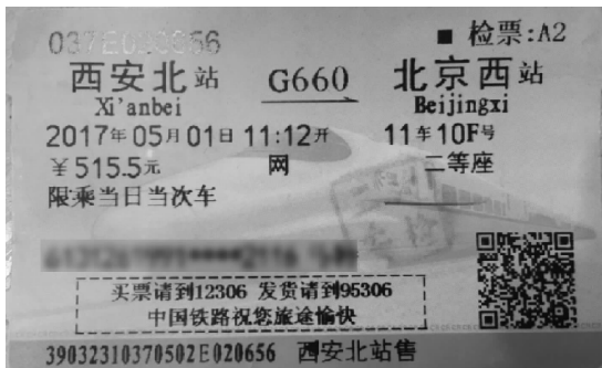
图 3-1 磁卡式车票