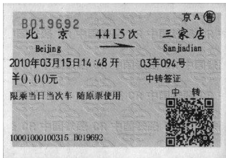
图 3-6 中转签证车票