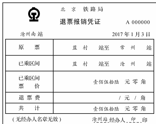
图 3-8 退票报销凭证