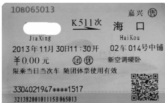
图 3-2 团体优惠票

(3)用计算机售票的车站在办理团体旅客票并实行一定优惠政策时,优惠票的票面打印“团优”字样(见图 3-2),其余票的票面上加印“团”字样。非计算机售票的车站发售优惠团体旅客票时一律填发代用票,人数栏的其中一栏可以改为免收栏,记事栏记录团体旅客证起止号码。