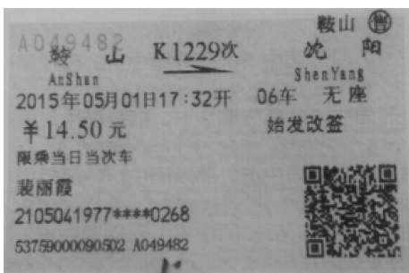
图 3-5 始发改签车票