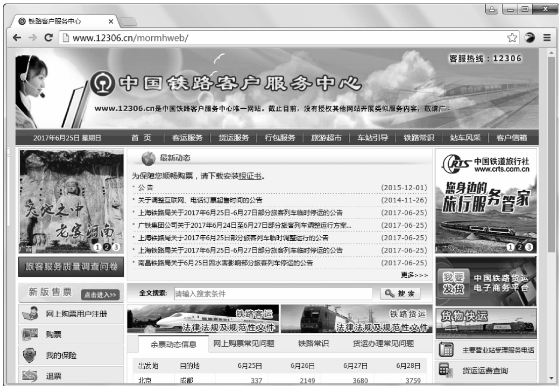
图 3-4 12306 网站界面

铁路互联网售票是指通过中国铁路客户服务中心网站(12306 网站,见图 3-4)销售铁路电子客票及其改签、退票等业务。