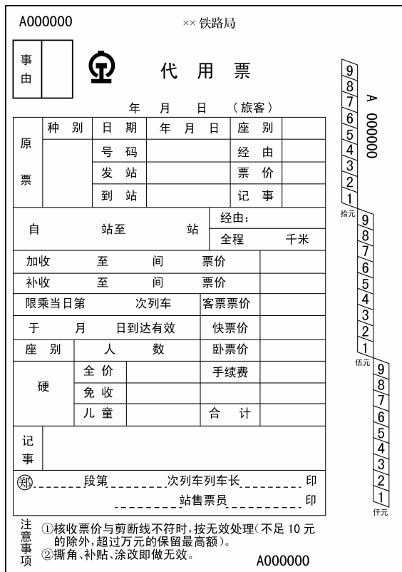
图 3-3 代用票