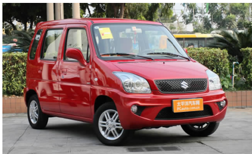
图 4-51 昌河北斗星

昌河汽车公司主要产品品种有派喜、北斗星(见图4-51)、北斗星X5、北斗星e+、浪迪S-MPV、利亚纳两厢/三厢经济型轿车、福瑞达微型客车(见图4-52)、福瑞达微型单/双排货车、爱迪尔、爱迪尔II、爱迪尔A+、K14B和K12B系列发动机等产品。昌河汽车公司的产品覆盖微型客(货)车、经济型轿车、小型商务车和发动机等领域。