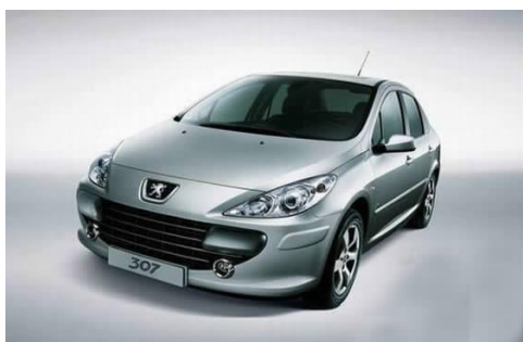
图 4-14 东风标致 307