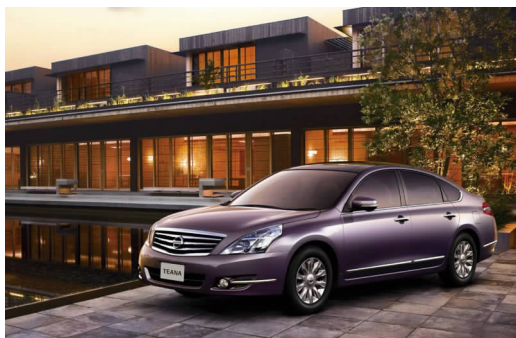
图 4-9 东风日产天籁轿车

2010年9月,东风日产正式发布自主品牌“启辰”。“启辰”的诞生,标志着东风日产已进入“双品牌”运营阶段。目前,NISSAN品牌旗下拥有楼兰、天籁(见图4-9)、奇骏、逍客、轩逸、骐达、—、骊威、玛驰等多款畅销车型,以及高端MPV新贵士、高性能跑车370Z、全能超级跑车GT-R等进口车型。加上2012年诞生的自主品牌启辰D50(见图4-10)、R50车型,东风日产已形成高端品类、旗舰品类、家轿品类、时尚动感品类和SUV品类五大品类车型布局,是行业内车型最多、产品线最完整的企业之一。