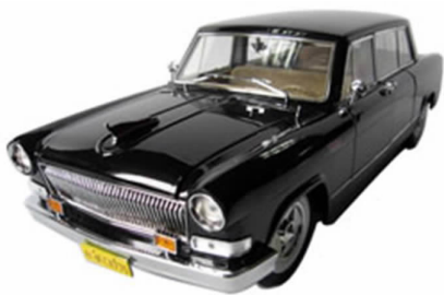
图 4-3 红旗牌高级轿车

截至 2012 年 3 月,中国一汽拥有职能部门 22 个,分公司 5 个,全资子公司 6 个,控股子公司 4 个。其中上市公司 4 个,分别是一汽轿车股份有限公司、长春一汽富维汽车零部件股份有限公司、天津一汽夏利汽车股份有限公司、启明信息技术股份有限公司。一汽的主营业务板块按领域划分为:研发、乘用车、商用车、零部件和衍生经济等体系。一汽拥有员工 12 万人,资产总额 2 136.5 亿元。