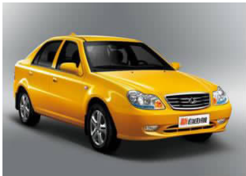
图 4-43 吉利自由舰

吉利集团拥有“帝豪”、“全球鹰”、“英伦”三大品牌;现有吉利自由舰(见图4-43)、吉利金刚、吉利远景、吉利熊猫(见图4-44)、上海华普、中国龙等八大系列30多个品种整车产品;拥有1.0L~1.8L八大系列发动机及八大系列手动与自动变速器。