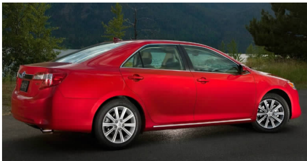
图 4-37 广汽丰田凯美瑞