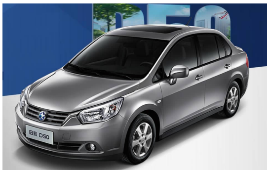
图 4-10 东风日产启辰 D50

2012年10月,东风日产第400万辆整车下线,刷新行业最快纪录。到2015年,东风日产四大基地整车总产能有望从现有的100万辆提升至150万辆。