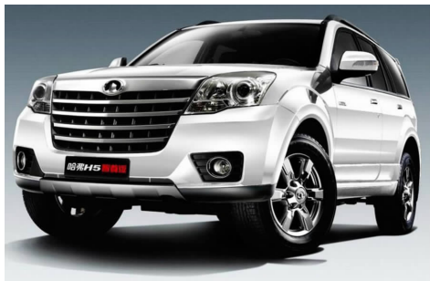
图 4-48 长城哈弗 H5