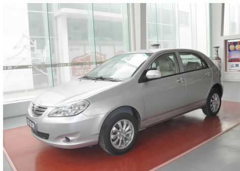
图 4-42 比亚迪 G3R