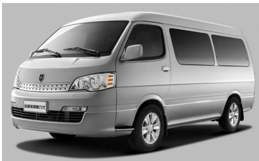
图 4-46 金杯海狮

2012 年，华晨汽车集团实现整车销售 67.2 万辆，实现发动机销售 82.5 万台，实现销售收入 1 067 亿元。