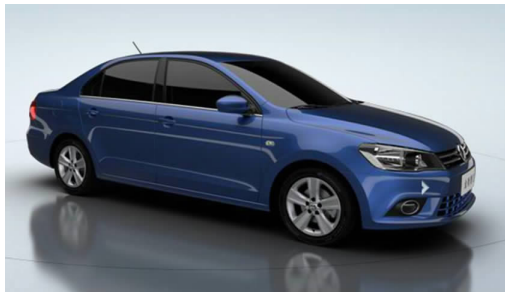
图 4-5 捷达轿车