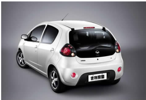
图 4-44 吉利熊猫