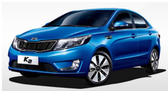
图 4-16 东风悦达起亚 K2

东风悦达起亚汽车有限公司系由东风汽车公司、江苏悦达投资股份有限公司、韩国起亚自动车株式会社共同组建的中外合资轿车制造企业，目前拥有两个生产基地，产能规模达到 62 万辆，在建的第三工厂预计 2014 年投产，产能 30 万辆。其主要产品有 K3、K2/K2 两厢（见图 4-16）、K5 Nu、福瑞迪、智跑、新秀尔、新狮跑、赛拉图（见图 4-17）、锐欧等。