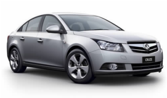
图 4-23 上海通用科鲁兹