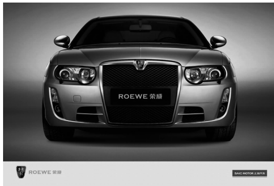
图 4-18 荣威轿车

源于上海汽车之前收购的罗孚,但上海汽车并未收购“罗孚”品牌,而是将其定名为“荣威 (ROEWE)”,如图 4-18 所示,取意“创新殊荣、威仪四海”。荣威的品牌在 4 年时间里发展迅速,其产品已经覆盖中级车与中高级车市场,“科技化”已经成为荣威汽车的品牌标签。