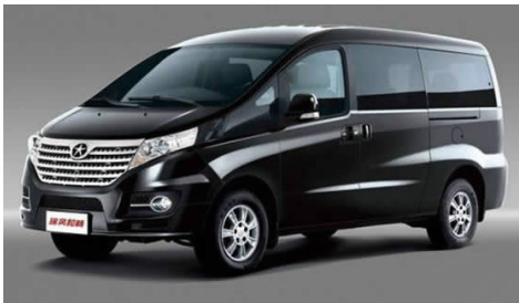
图 4-49 瑞风商务车

目前,江淮汽车主导产品有6~12 m 客车底盘,0.5~50 t 重、中、轻、微卡车,星锐多功能商用车,6~12座瑞风商务车(见图4-49),瑞鹰越野车,C级宾悦(见图4-50)、B级和悦、和悦RS、A级同悦、同悦RS、A0级悦悦轿车。