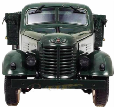
图 4-1 解放牌卡车

中国第一汽车集团公司简称“中国一汽”或“一汽”，是国有特大型汽车生产企业，总部位于吉林省长春市，前身是第一汽车制造厂。一汽 1953 年奠基兴建，1956 年建成并投产，制造出新中国第一辆解放牌卡车，如图 4-1 所示；1958 年制造出新中国第一辆东风牌小轿车和第一辆红旗牌高级轿车，如图 4-2、图 4-3 所示。一汽的建成，开创了中国汽车工业新的历史。经过 50 多年的发展，一汽已经成为国内最大的汽车企业集团之一。