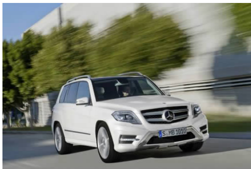
图 4-30 北京奔驰 GLK 级豪华中型 SUV