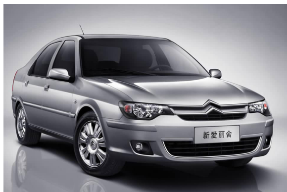
图 4-15 东风雪铁龙新爱丽舍