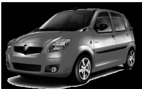
图 4-27 长安逸动