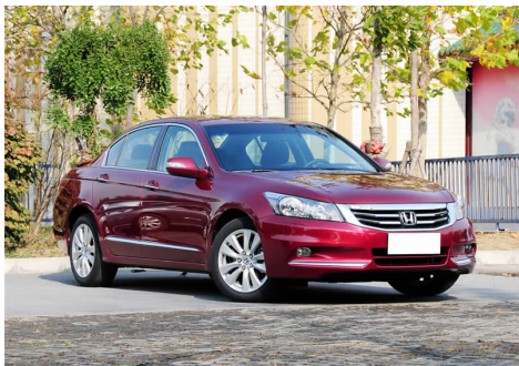
图 4-35 广汽本田雅阁

广汽本田汽车有限公司(原名广州本田汽车有限公司)于1998年7月1日成立,是由广州汽车集团公司与日本本田技研工业株式会社共同出资组建的合资公司。广汽本田拥有黄埔工厂和增城工厂两个厂区,生产能力合计达到年产48万辆。广汽本田的量产车型包括本田品牌的歌诗图、雅阁(见图4-35)、奥德赛、凌派、锋范、飞度(见图4-36)六大系列车型和理念品牌的理念S1车型,同时以进口方式销售混合动力车型Honda CR-Z和FIT HYBRID。