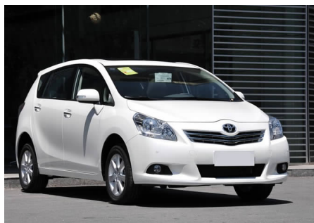
图 4-38 广汽丰田逸致

广汽丰田的凯美瑞车型上市立即畅销,一举创下连续 15 个月蝉联中国中高级轿车销量桂冠的神话,其中 2007 年和 2008 年蝉联中高级轿车上牌量第一。2011 年 8 月 4 日,广汽丰田公司第 100 万辆汽车下线,成为在以中高级轿车为主力产品的车企中,最快实现百万辆下线的企业之一。