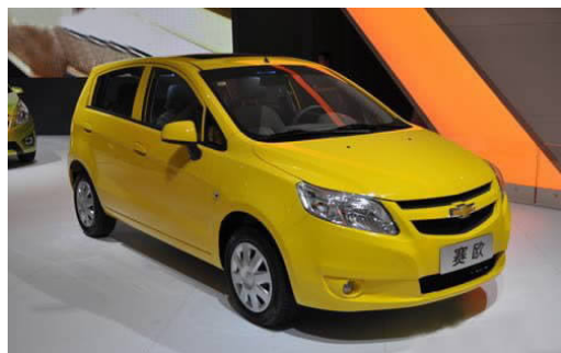
图 4-24 上海通用赛欧