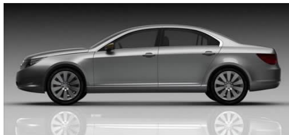
图 4-50 C 级宾悦