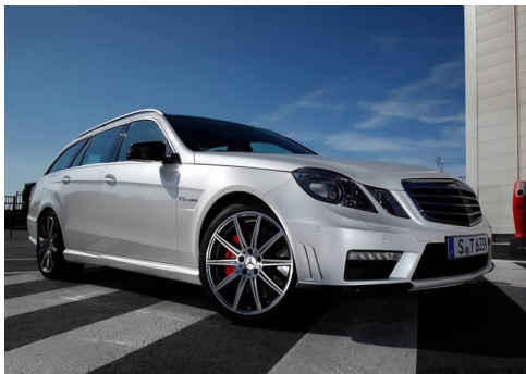
图 4-29 北京奔驰长轴距 E 级轿车