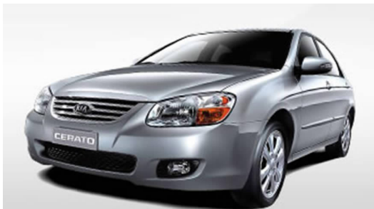
图 4-17 东风悦达起亚赛拉图