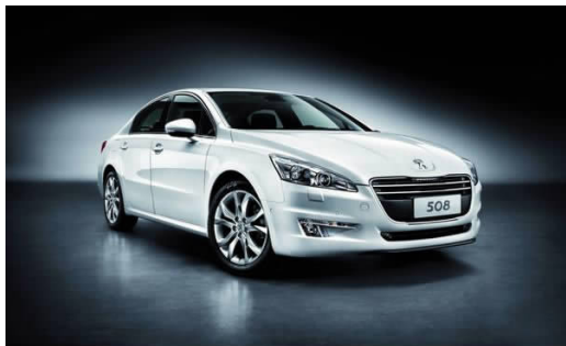
图 4-13 东风标致 508

2002年10月,东风汽车公司与标致-雪铁龙集团签订扩大合作的合资合同,两大集团强强联手,全面展开将标致品牌引入中国的新蓝图,东风标致由此诞生。东风标致品牌,秉承“同心同行、标新致远”的品牌理念,目前拥有508(见图4-13)、408、308、307(见图4-14)、207等车型系列产品,覆盖高端、中高端、经济型及SUV多个乘用车细分市场。