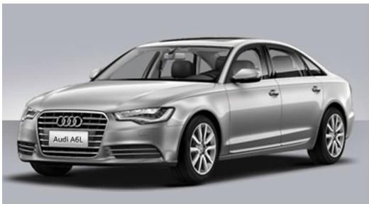
图 4-4 奥迪 A6L

经过 20 多年的发展,一汽-大众已经从建厂之初的一个品牌一款产品,发展到现在的奥迪、大众两大品牌 9 大系列产品——奥迪 A6L(见图 4-4)、奥迪 Q5、奥迪 A4L、迈腾、CC、速腾、宝来、高尔夫和捷达轿车(见图 4-5),每款产品无论是性能还是销量都是其细分市场里的主导产品。一汽-大众已成为国内成熟的 A、B、C 全系列乘用车生产制造基地,从 1991 年 12 月 5 日第一辆捷达轿车组装下线到 2012 年底,一汽-大众已经累计生产整车 677.26 万辆。