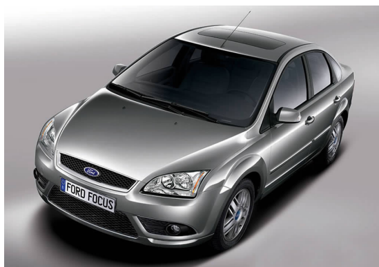
图 4-26 福克斯