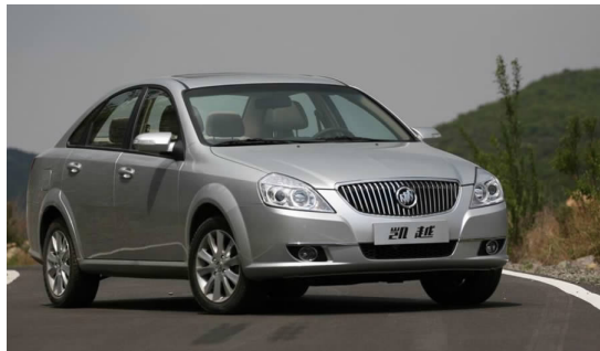
图 4-22 上海通用凯越