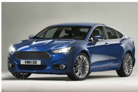
图 4-25 蒙迪欧-致胜