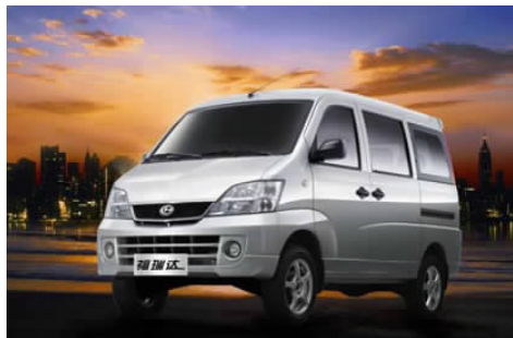
图 4-52 昌河福瑞达微型客车