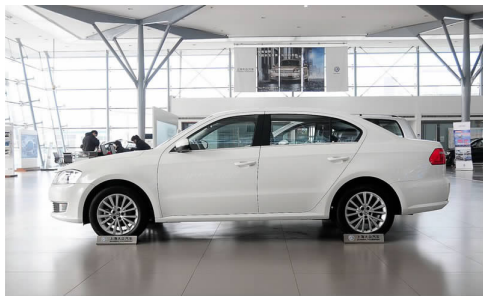
图 4-19 上海大众朗逸

上海大众是国内规模最大的现代化轿车生产基地之一。基于大众汽车、斯柯达两大品牌,公司目前拥有波罗(Polo)、途安(Touran)、朗逸(Lavida)(见图 4-19)、途观(Tiguan)(见图 4-20)、桑塔纳(Santana)、帕萨特(Passat)和晶锐(Fabia)、明锐(Octavia)、昊锐(Superb)等十大系列产品,覆盖 A0 级、A 级、B 级、SUV 等不同细分市场。