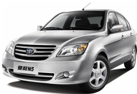
图 4-7 天津一汽夏利轿车