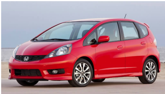
图 4-36 广汽本田飞度

2007年7月19日,广汽本田成立广汽本田汽车研究开发有限公司,这是国内第一个由合资企业独立投资、以独立法人模式运作、具有整车独立开发能力的汽车研发机构。广汽本田汽车研究开发有限公司的成立,标志着合资企业自主品牌正式破题,对于提升中国汽车工业的自主研发能力具有重要的意义。