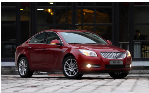
图 4-21 上海通用君威

目前,上海通用旗下的产品主要有君威(见图 4-21)、君越、英朗、凯越(见图 4-22)、景程、科鲁兹(见图 4-23)、赛欧(见图 4-24)、科帕奇等。