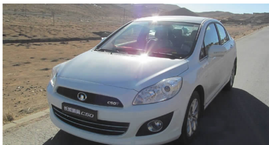
图 4-47 长城 C50

目前，长城汽车旗下的产品主要有长城 C50(见图 4-47)、长城 C30、长城 V80、长城 M2、长城 M4、哈弗 H5(见图 4-48)、哈弗 H6 等。