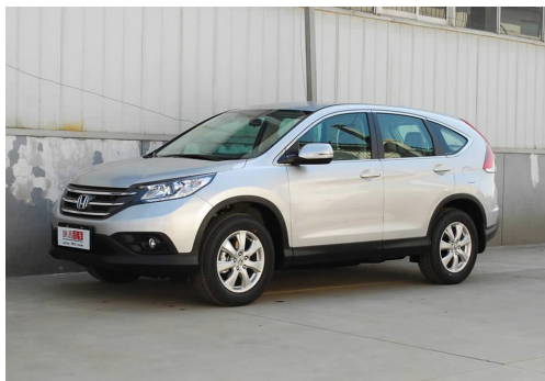
图 4-11 东风本田思威