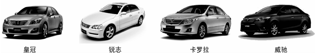
图 4-6 天津一汽丰田部分轿车车型

截至2010年1月,天津一汽丰田累计生产汽车超过150万辆,连续投放了威驰(VIOS)、皇冠(CROWN)、锐志(REIZ)、卡罗拉(COROLLA)及RAV4等系列产品,如图4-6所示,完成了从经济型轿车到中高级轿车的产品布局。2009年3月城市型SUV车型RAV4的投产,是天津一汽丰田由单一轿车产品向轿车、SUV车型多样化发展的重要标志。