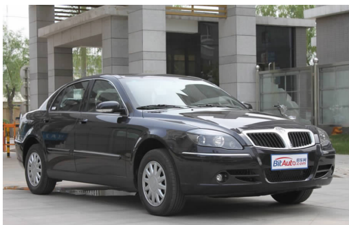
图 4-45 中华骏捷

截至 2012 年，华晨汽车集团在国内已建成南北两大产销基地，6 个整车生产企业、4 个发动机生产企业和多家零部件生产企业，具备国内少有的整车造型、设计能力、样车制造、整车匹配开发及发动机等核心汽车零部件的设计、开发能力。企业通过高起点自主创新，打造了“中华”、“金杯”两大自主整车品牌及“华晨宝马”合资整车品牌，产品已覆盖乘用车、商用车全领域。目前，华晨汽车集团旗下的产品主要有中华骏捷(见图 4-45)、中华尊驰、中华酷宝、金杯海狮(见图 4-46)等。