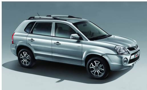
图 4-33 途胜