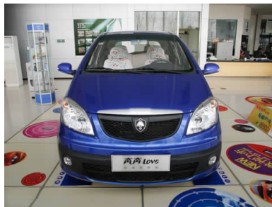
图 4-28 长安奔奔