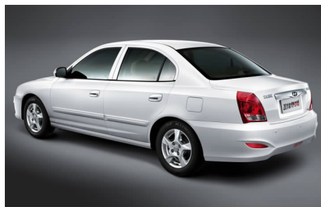
图 4-32 伊兰特