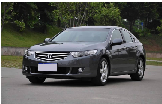
图 4-12 东风本田思铂睿