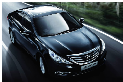
图 4-34 索纳塔