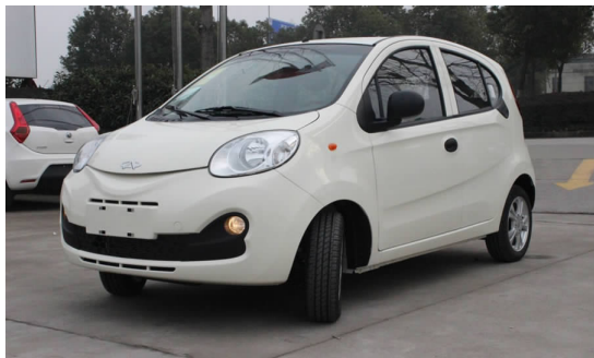
图 4-39 奇瑞 QQ

目前,奇瑞旗下的产品主要有 QQ(见图 4-39)、A3(见图 4-40)、旗云、瑞麒、瑞虎、东方之子等。