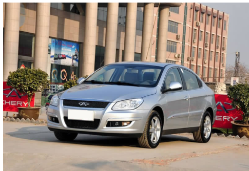
图 4-40 奇瑞 A3