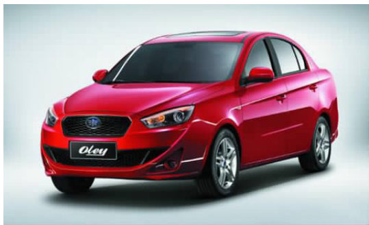
图 4-8 一汽欧朗汽车

一汽轿车股份有限公司,简称“一汽轿车”,是中国第一汽车集团的控股子公司,是一汽集团发展自主品牌乘用车的主要企业之一。公司的主营业务为开发、制造和销售乘用车及其配件,年生产能力轿车整车 40 万辆,发动机 33 万台,变速器 52 万台。一汽轿车现有红旗、一汽奔腾、一汽欧朗、Mazda 等乘用车产品系列。全新品牌一汽欧朗(见图 4-8)于 2011 年 11 月发布、2012 年 4 月正式上市。