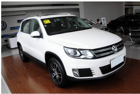
图 4-20 上海大众途观