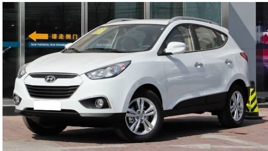
图 4-31 现代 ix35

北京现代旗下的品牌有瑞纳、现代 ix35(见图 4-31)、伊兰特(见图 4-32)、伊兰特-悦动、i30、雅绅特、途胜(见图 4-33)、名驭、索纳塔(见图 4-34)、伊兰特-朗动、全新胜达等。