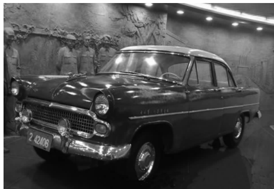
图 4-2 东风牌小轿车